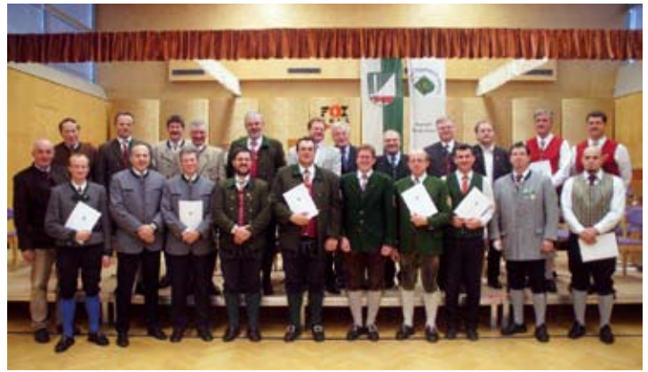
Konzertwertung in Niederwölz