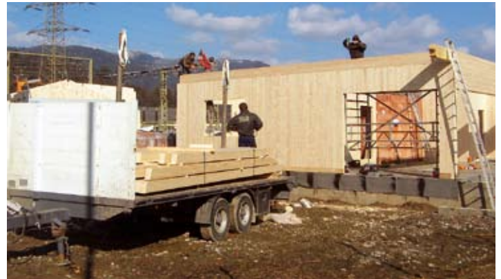
Tüchtig wird am Neubau des Tennisvereinsheims gearbeitet

Viele fleißige Hände tragen jedes Jahr dazu bei, dass die Tennisplätze wieder auf Vordermann gebracht werden. Dabei findet sich der Nachwuchs genauso ein wie die arrivierten Spieler. Der alte Sand muss abgetragen, die Linien neu gespannt und Sand aufgetragen werden. Im Teamwork geht das alles viel leichter und spart obendrein viel Geld. Erfreulich das auch das neue Camping und Clubhaus bereits Formen angenommen hat. Dabei wurde ebenfalls kräftig in die Hände gespuckt. 2 Wochen hindurch waren Spieler und Funktionäre dabei die Untersichten, Sparren und Schalungen zu streichen und das waren nicht wenige sieht man jetzt auf das bereits stehende Gebäude. Ebenfalls beteiligt war die Gemeinde selbst an den Vorbereitungsarbeiten in der Zimmerei Galler wo sämtliche Teile vorgefertigt wurden. Die Gemeindearbeiter Gerhard Rautner und Willibald Gruber leisteten