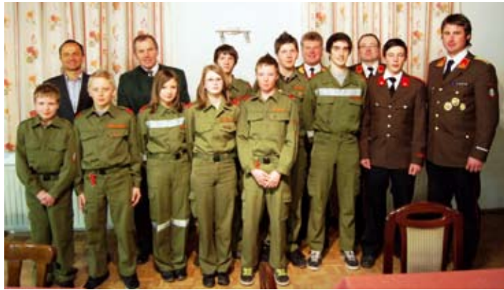
Die tüchtige Teufenbacher Feuerwehrjugend

Diese große Leistung würdigten auch die Ehrengäste