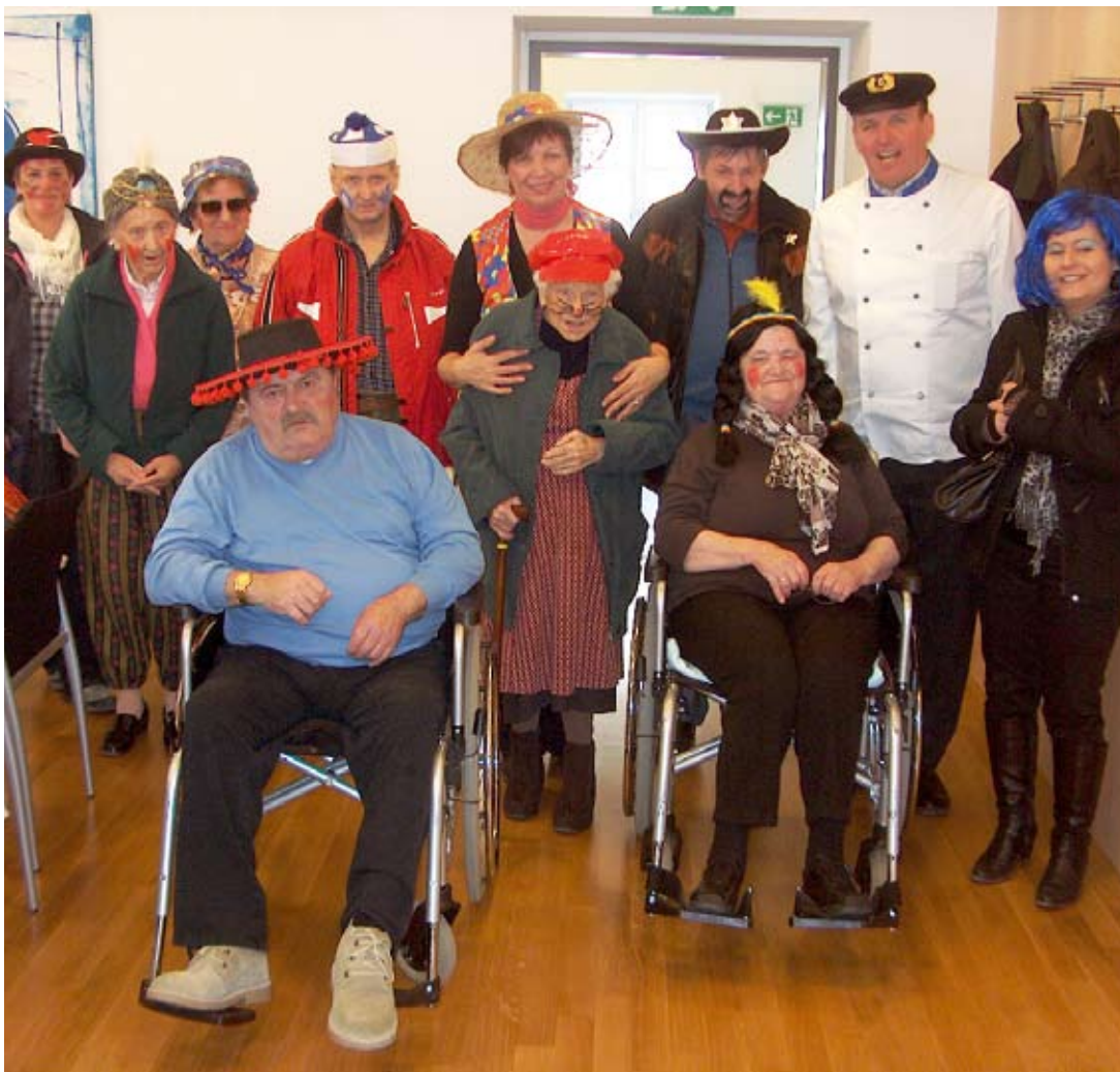
Fasching hält jung – unter diesem Motto feierten auch die Senioren mit