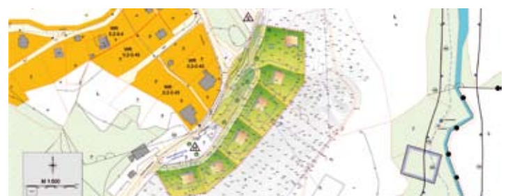
Entwurf des Teilbebauungsplanes Tatistscheff