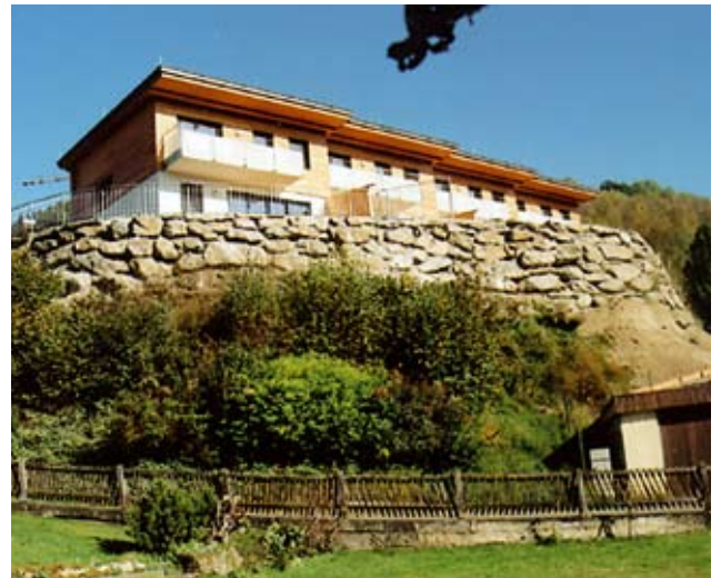
Wohnen auf der „Steinplatte“