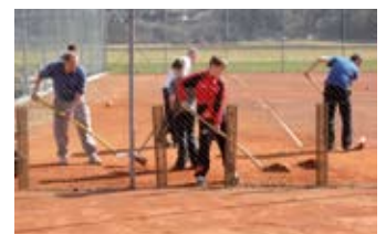
Tennisplatz wird auf Vordermann gebracht