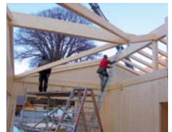
Das Clubhaus nimmt bereits Formen an

hier viele Stunden. Eigenleistungen die man mit über 5.000 Euro beziffern kann. Gemeinsam ist man bestrebt die Kosten so niedrig wie möglich zu halten. Einen besonderen Energiespareffekt soll die künftige Warmwasseraufbereitung auch für die Duschen im Campingbereich erzielen, wird doch alles von der neuen Solaranlage gespeist. Damit ist zumindest eines garantiert, im Sommer wird kein Öl mehr verheizt. Ein tolles Gemeinschaftswerk und die Freude auf die Eröffnung sind bereits groß.