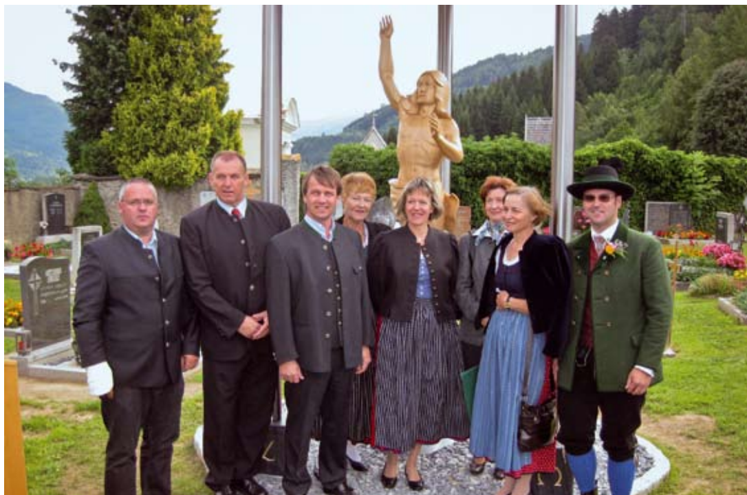
Initiatoren und Sponsoren des Kunstwerkes für den Friedhof