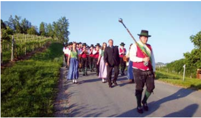
Der Musikverein beim „Einmarsch“ in Seggau