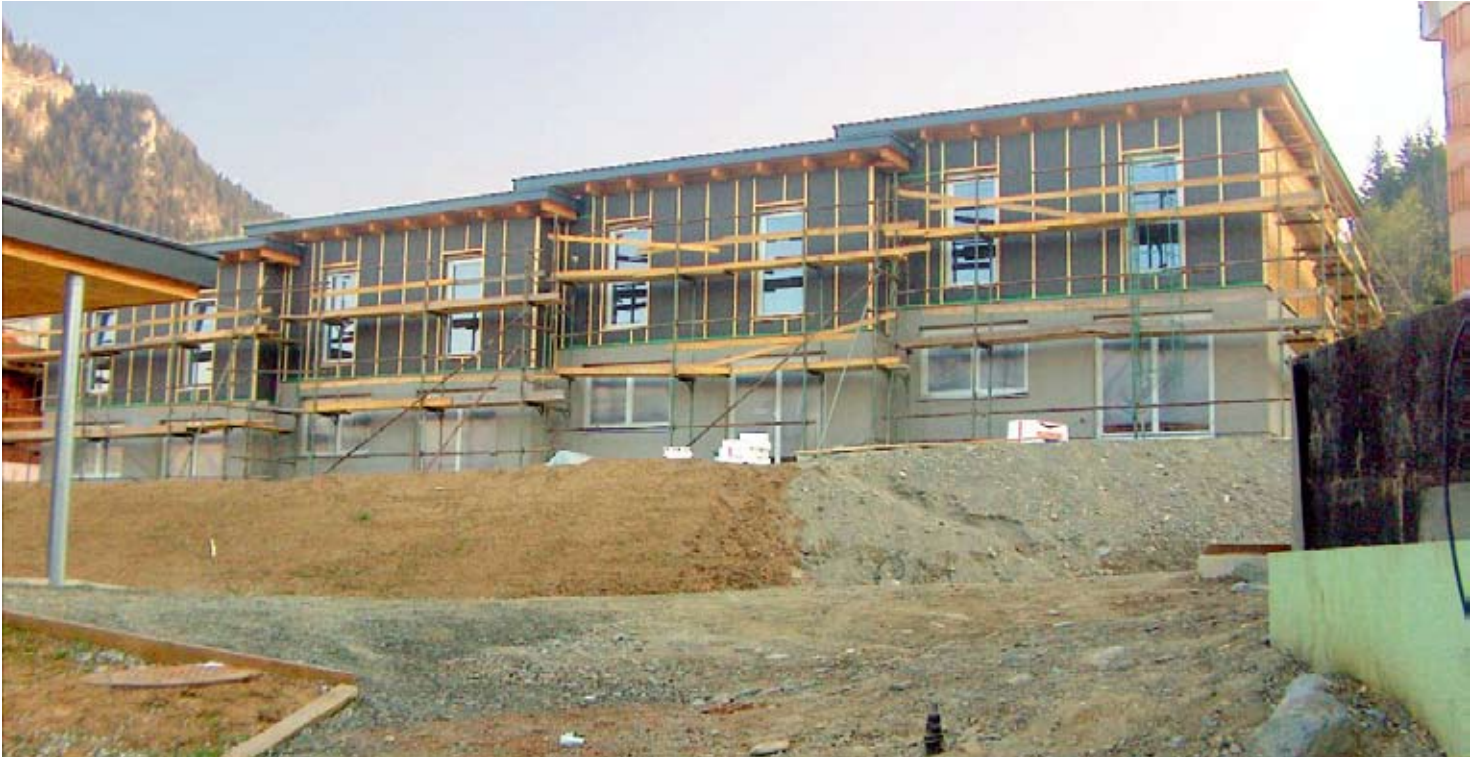
Voll im Zeitplan – Kurz vor der Anbringung der Lärchenschalung der Zimmerei Galler Franz GmbH, ÖWGes